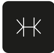
Doble vidrio templado